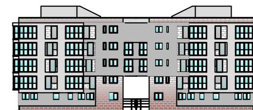
C. Juan Sebastian el Cano