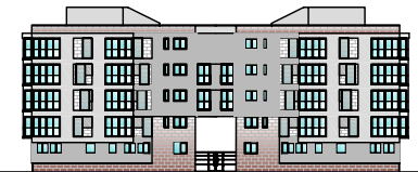
C. Juan Sebastian el Cano