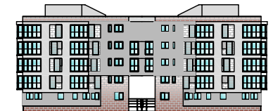
C.\ Juan Sebastian el Cano