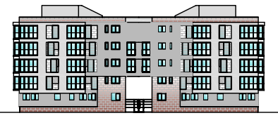
C.V. Juan Sebastian el Cano