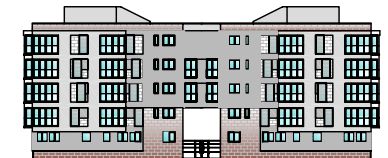
C.V. Juan Sebastian el Cano